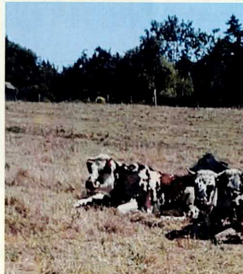
La ferme du Château ... en 1916 ( ? ) carte postale (rare)

Une question non résolue dans les petites communes rurales bocagères où notamment les haies ont en partie été arrachées : comment gérer les flux massifs d'eaux pluviales ?