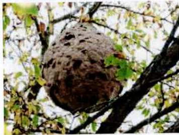
Le nid se situait à 22m de hauteur

La commune règle le solde à payer : aucun frais pour les habitants.