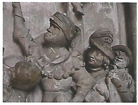
Bas relief montrant des soldats anglais (Cathédrale de Lisieux, XV e siècle)