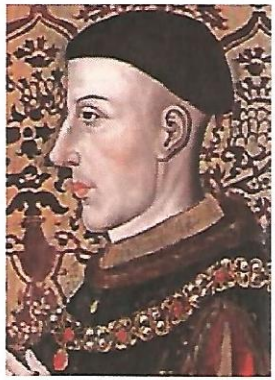
Henri V d'Angleterre