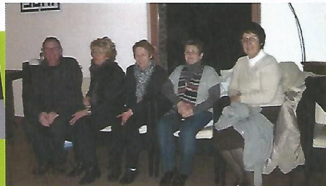
Certains ont même déjà leur Cour...