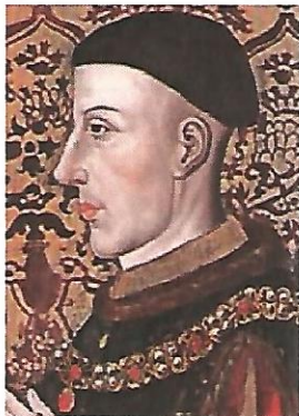
Henri V d'Angleterre