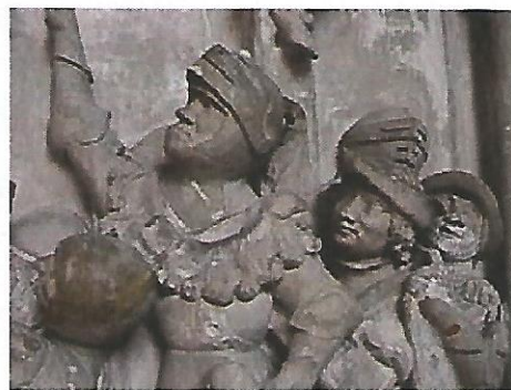
Bas relief montrant des soldats anglais (Cathédrale de Lisieux, XV e siècle)